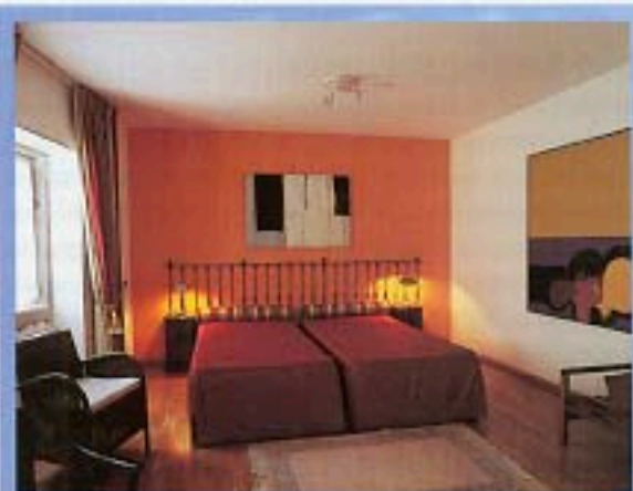
SOPRA UNA CAMERA DEL SOLAR DOS MOUROS, IN ALTRI VISTA SULLA CITTÀ DAL METROPOLIS.

A udace, moderna e insieme decadente, ricca di cultura, soprattutto affascinante. Questa è Lisbona, una delle prime città europee ad avere avuto il coraggio di cambiare volto senza snaturare la propria storia. È bello perdersi tra le sue vie monumentali, scoprire scorci, annusare il profumo dell'oceano che arriva trasportato dal Tago. In questo contesto, ecco dodici indirizzi d'ospitalità ben caratterizzati, dall'hotel storico alla pensione, dove un sincero sorriso d'accoglienza vale più di ogni altra cosa, per vivere un soggiorno da veri lisboeti.