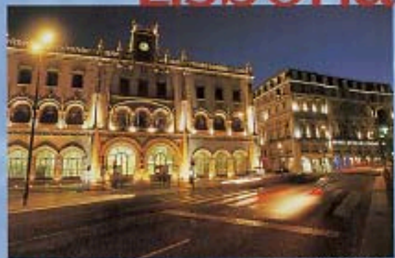
ESTÁÇÃO CENTRAL. COSTRUITA IN STILE ECLETICO (1887/1890).

HOTEL LISBOA TEJO LA HALL. RISCOTO MIX DI ANTICO E MODERNO.