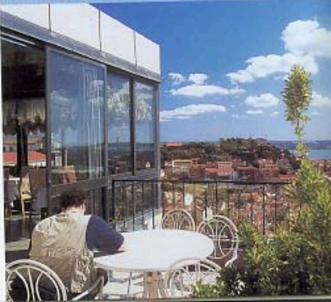
Albergaria Senhora do Monte. Ampio belvedere sulla città.