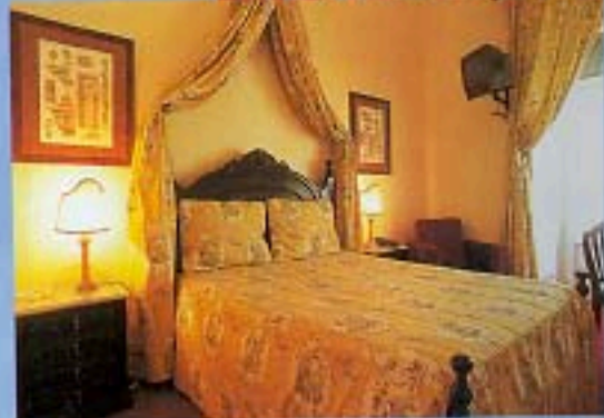
CASA DE SÃO MAMEDE ARREDI ORIGINALI NELLE CAMERE.