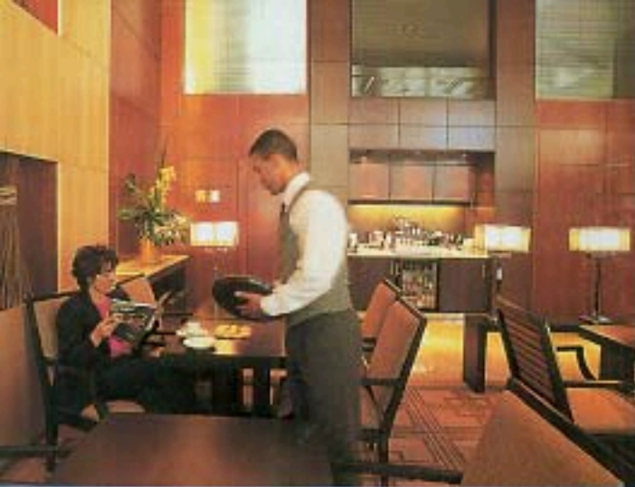
DOM CARLOS LIBERTY LA SALA DELLA PRIMA COLAZIONE.