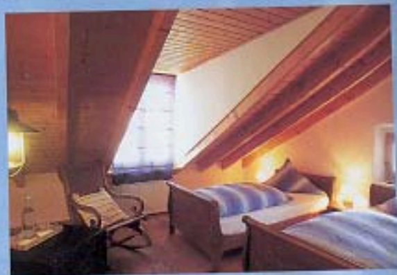
Casa Costa do Castelo. Una camera in mansarda.

Alle spalle del Castello, indirizzi in palazzi storici e panorami sul Tago