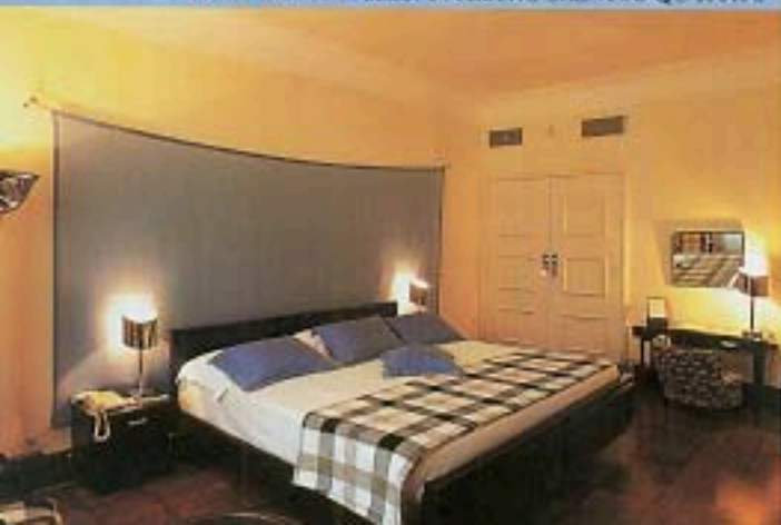
HOTEL BRITANIA ARREDI IN PERFETTO STILE ANNI QUARANTA.

Preziose camere in stile e arredi ricercati, per vivere l'atmosfera della Capitale