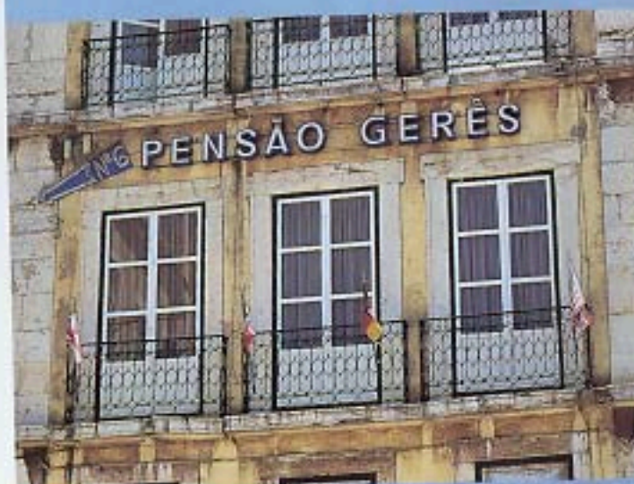
Pensão Gerês in un antico palazzo, a due passi dal Rossio.

Alle spalle del Castello, indirizzi in palazzi storici e panorami sul Tago