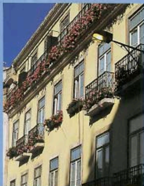
RESIDENCIAL ALEGRIA BALCONI FIORITI E STANZE SEMPLICI.

Preziose camere in stile e arredi ricercati, per vivere l'atmosfera della Capitale