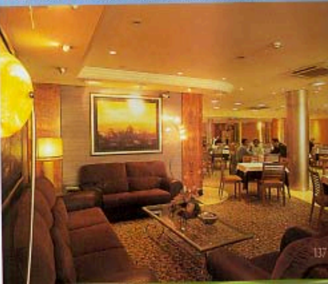
HOTEL TRAVEL PARK LISBOA LA SALA DELLA PRIMA COLAZIONE.