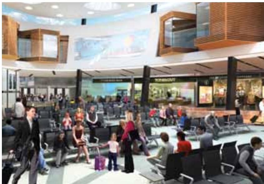
Dois ângulos da futura praça central

A oferta do “Travel Retail” (oferta a clientes em viagem) em Portugal, por exemplo, está mais desenvolvida nos aeroportos do que noutras infra-estruturas de transporte. Ao nível mundial existem alguns players focados no negócio do “Travel Retail” e normalmente ou têm marcas