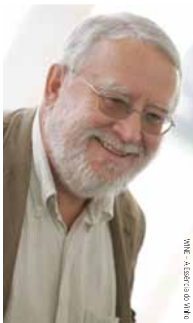
WINE - A Essência do Vinho