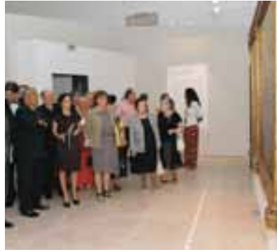
Na Sala do Risco, os visitantes detêm-se junto a uma das obras expostas