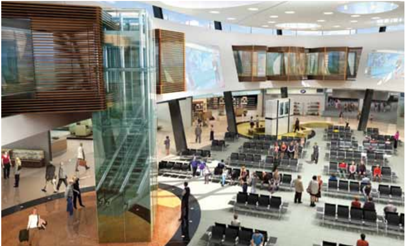
Futura praça central do Aeroporto de Lisboa