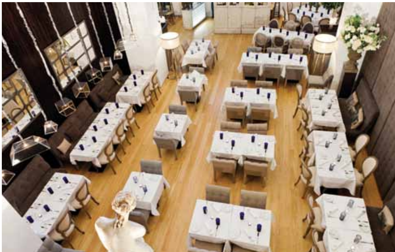
A decoração do Aura resulta de uma mistura de épocas, materiais e texturas

pois gostamos de melhorar a cada dia. Por isso, é óptimo recebermos críticas construtivas, que nos estimulam a ir sempre mais longe, ao encontro das expectativas dos nossos clientes.