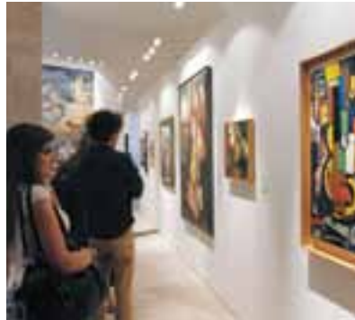
A exposição Ecos do Fado foi alvo de grande interesse e curiosidade