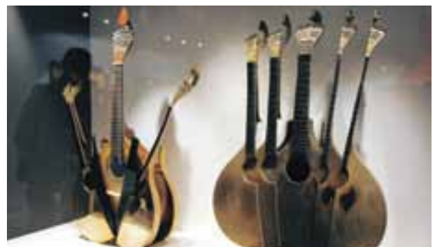
O Fado e a guitarra portuguesa são inseparáveis