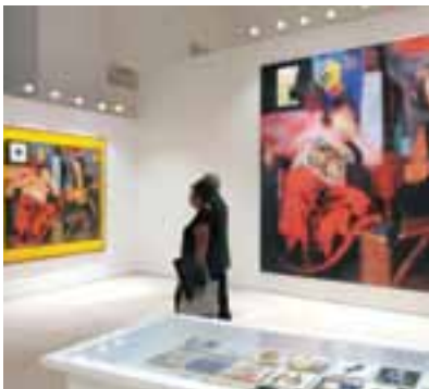
O Fado visto por grandes mestres da pintura portuguesa