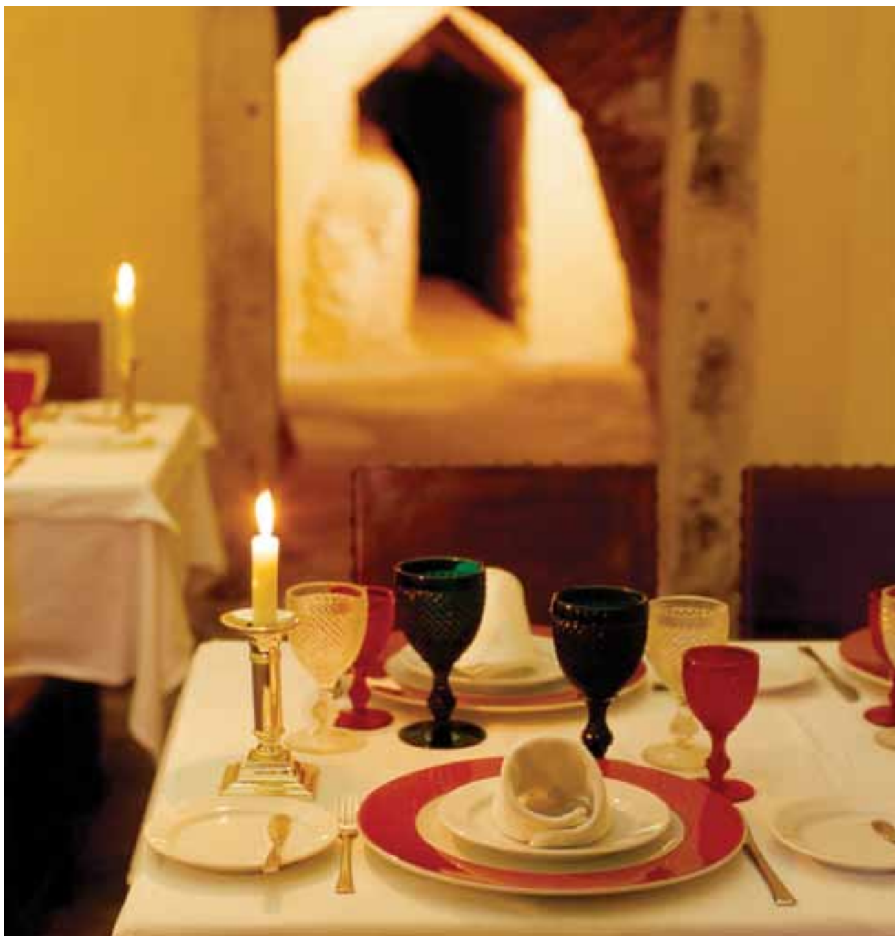
O requinte à mesa