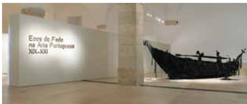
“Barco Negro”, da autoria de João Pedro Vale

Desde a sua inauguração, em 25 de Fevereiro deste ano, o Pátio da Galé recebeu já eventos de grande notoriedade como a “ModaLisboa” e o “Peixe em Lisboa”, aos quais se juntam a exposição Ecos do Fado, e diversas iniciativas ligadas ao Festival dos Oceanos.