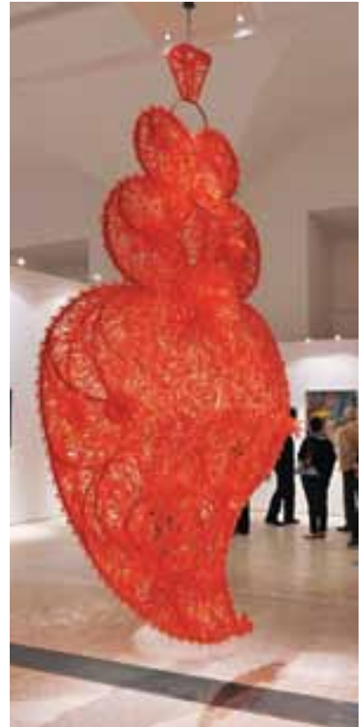
Criado com talhares de plástico, Coração Independente Vermelho é um trabalho de Joana Vasconcelos