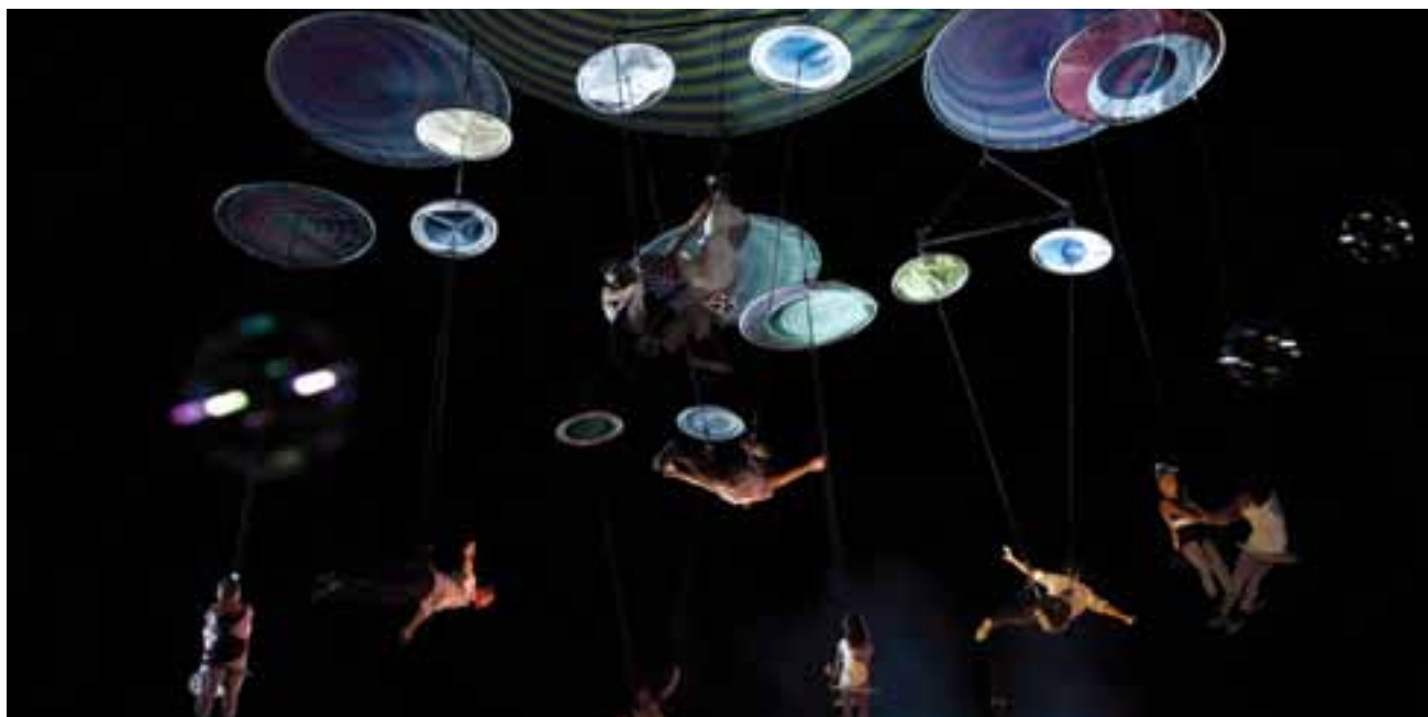
Festival dos Oceanos

PRESTES A TERMINAR A CONTAGEM DECRESCENTE PARA O ARRANQUE DO FESTIVAL DOS OCEANOS 2011, É GRANDE A EXPECTATIVA E A CURIOSIDADE SENTIDAS EM TORNO DA PROGRAMAÇÃO PREPARADA PARA MAIS UMA EDIÇÃO DESTA INICIATIVA DO TURISMO DE LISBOA